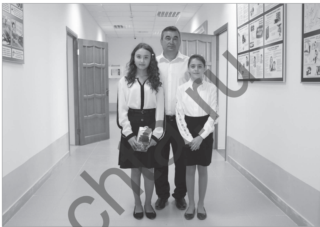
В прошлом году ученики сели за парты отремонтированной школы в с. Тугай.

жению территории во втором микрорайоне в рамках программы «Башкирские дворики».