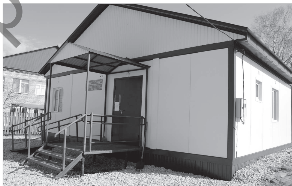
С появлением нового ФАПа в Саннинском мечтают о своем фельдшере.

и решать насущные проблемы помогают различные региональные программы. Так, в рамках партийного проекта «Реальные дела» на школьном дворе появилась детская площадка. Проект «Атайсал» помог селянам издать книгу истории населенных пунктов Саннинского сельского совета. Нынешнее поколение теперь из ее содержания узнает о малой родине своих предков. В рамках этого проекта была также облагорожена и территория нового модульного ФАПа.