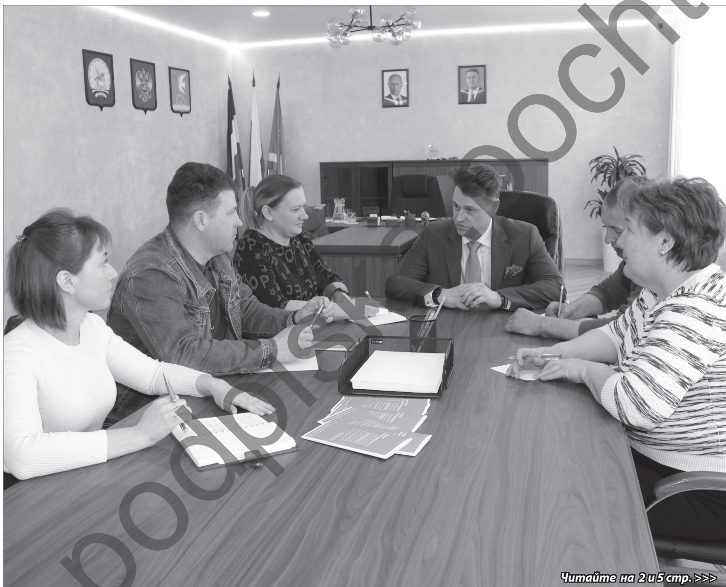
Читайте на 2 и 5 стр. >>>

Какие задачи ставит глава района перед командой муниципалитета