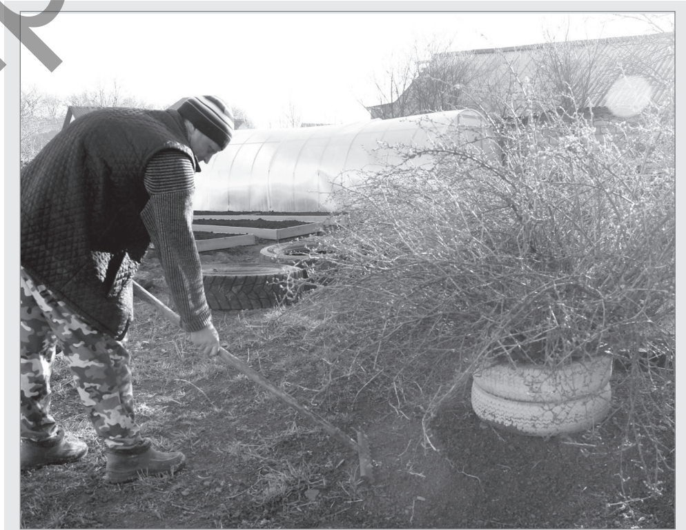
Наведите порядок на земле. Уберите мусор и листья, которые остались еще с осени, опавшие ветви деревьев, остатки мульчи и все то, что мешает вам открывать новый сезон.

Закрепите на деревьях ловчие пояса. Вместе с теплыми днями в сад пожалуют и насекомые, которые до этого успешно прятались по укромным местам. Уничтожить их можно, смастерив и закрепив на деревьях лов-