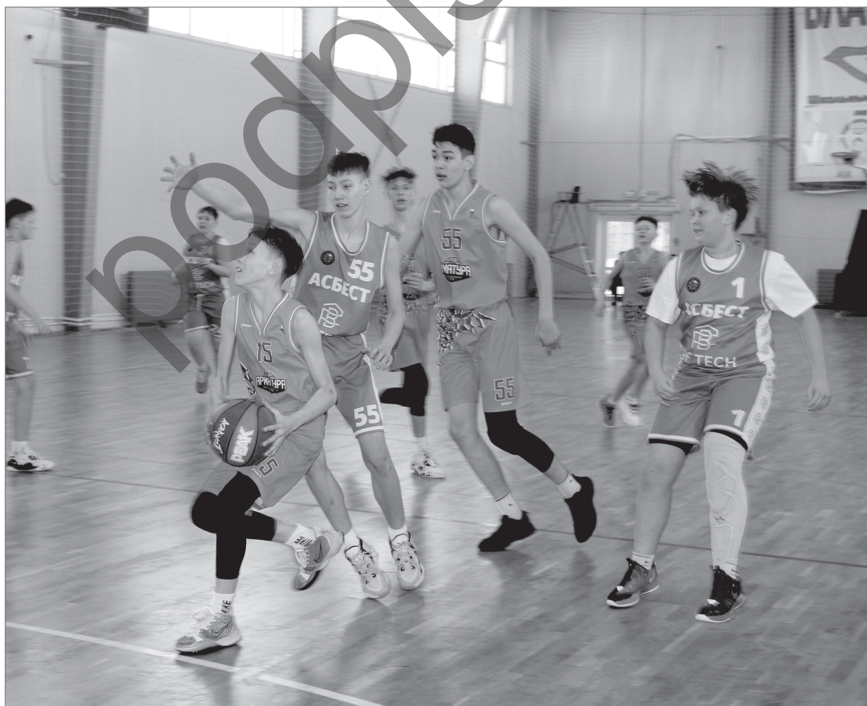
Матчи были напряженными и эмоциональными.