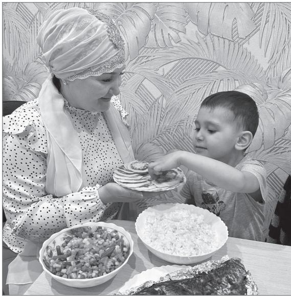
Устраивать праздничные обеды с родственниками - добрая традиция.