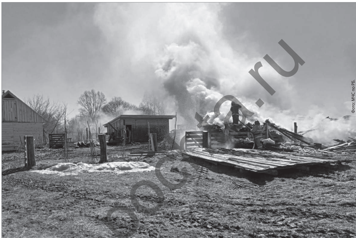
Огонь уничтожил надворные постройки многодетной семьи.

По местам отдыха граждан, территориям садоводческих и огороднических некоммерческих товариществ организованы рейды в целях пресечения возможных нарушений требований пожарной безопасности, автомобильное патрулирование районов с наибольшей плотностью застройки жилыми домами с низкой